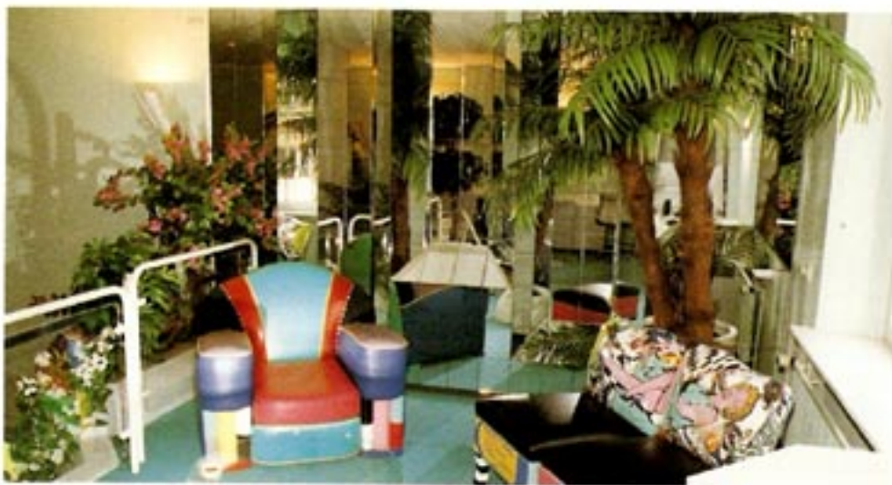
De VIP lounge in de praktijk in Kleef